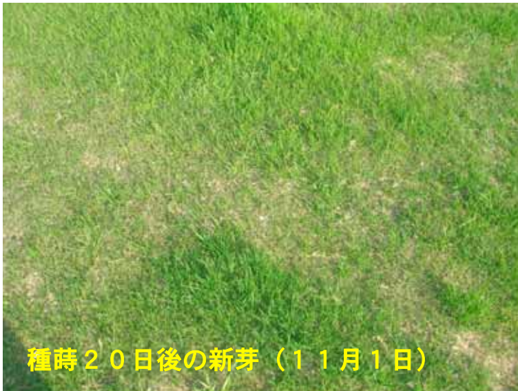
種蒔20日後の新芽 (11月1日)