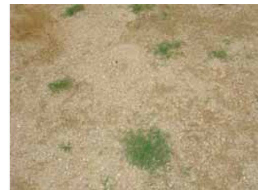
芝生植付(5月25日)の1ヶ月後(6月25日)の芝生育成状況