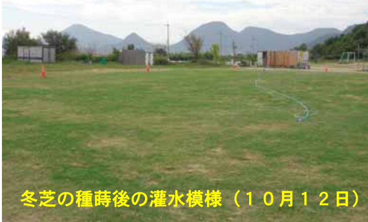
冬芝の種蒔後の灌水模様 (10月12日)