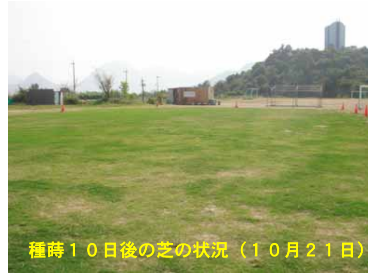
種蒔10日後の芝の状況 (10月21日)