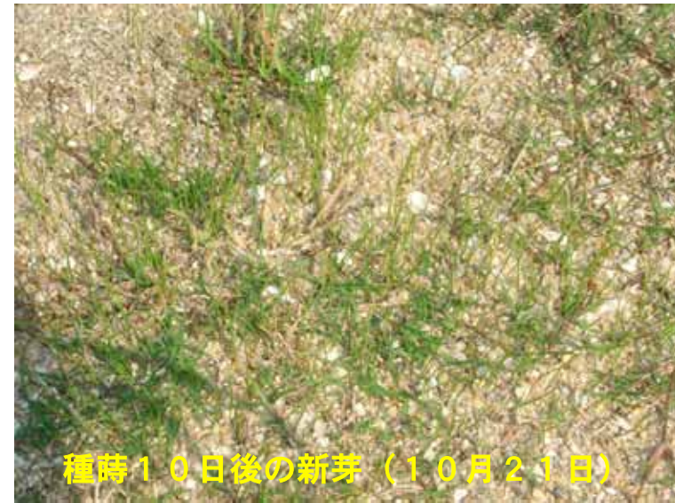
種蒔10日後の新芽 (10月21日)